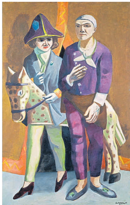
DOBLE RETRAT, CARNAVAL (1925). Beckmann es representa a si mateix vestit de Pierrot al costat de Quappi, disfressada de Napoleó, amb qui es casaria l'any següent; la parella sembla novuvinguda a una festa de disfresses, amb uns pesats cortinatges de fons que deixen entreveure que fora ja és negra nit. Quappi simula que va cavalcant, muntada en un cavall de cartró.

NATIONAL GALLERY, WASHINGTON, © VEGAP, MADRID