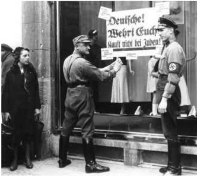
Alemanya, no compreu als jueus

76.- A quin fet fa referència aquesta imatge.