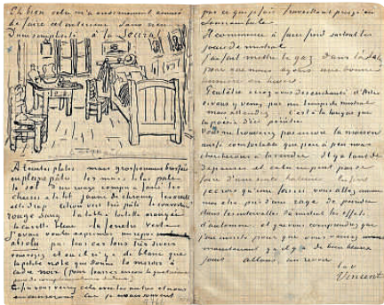
Dibuix de l'habitació que Van Gogh va incloure en una carta a Gauguin

> ven ara en diferents museus, a Amsterdam, Chicago i París; prova també de la importància que Van Gogh concedia a aquest espai personal i a la sèrie que li va dedicar és que apareix citat en almenys quinze cartes de les que l'artista va enviar al seu germà Theo, i en les quals va incloure també un esbós de la pintura. En una d'aquestes cartes, deia: "Aquesta vegada es tracta del meu dormitori, tot depèn aquí del color i de suggerir les idees de repòs o son donant, per simplificació, més vastitud al conjunt. La contemplació del quadre ha de proporcionar descans a la ment, o millor dit a la imaginació. Les parets són de to violeta clar i les cadires d'un groc de mantega fresca, les sabanes i coixins d'un verd llumina clar, el cobrellit vermell escarlata, la finestra verda, la taula en què hi ha les coses amb què em rento, ataronjada, el rentamans blau, les portes lila...". També va enviar un croquis al seu amic Gauguin.